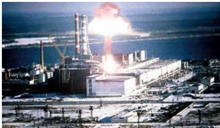
Фото взрыва на ЧАЭС

Это различие связано с тремя факторами: масса двух бомб, сброшенных на японские города, гораздо меньше массы топлива, использующегося на АЭС. Взрыв был произведен на высоте 600 метров над поверхностью, поэтому часть радиоактивных веществ поднялась вместе с воздушными потоками и была развеяна. В реакции деления при взрыве бомбы было задействовано около 800 грамм урана, тогда как остальная масса была отброшена в стороны колоссальным взрывом. Это не идет ни в какое сравнение с тоннами радиоактивных веществ, распространившимся по окрестностям Чернобыля.