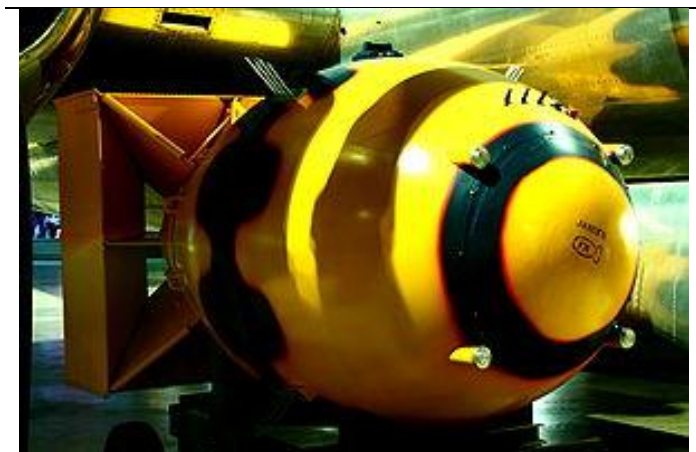
Макет бомбы «Толстяк», сброшенной на Нагасаки

долине, большая часть города от взрыва не пострадала. Тем не менее тысячи человек скончались на месте, ещё 75 тысяч получили ранения.